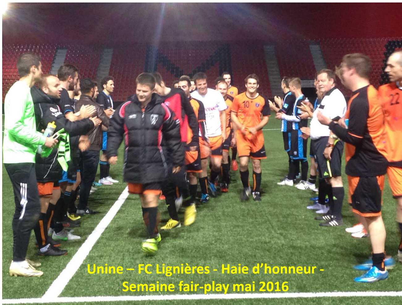
Unine – FC Lignières - Haie d'honneur - Semaine fair-play mai 2016